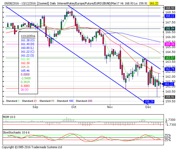
德國 10 年期國債：(H17) 多頭需收於通道上軌上方

阻力位 4：163.06 阻力位 3：162.74 阻力位 2：162.32 阻力位 1：161.40 12月5日高點 日下跌通道上軌 21日均線 12月12日高點