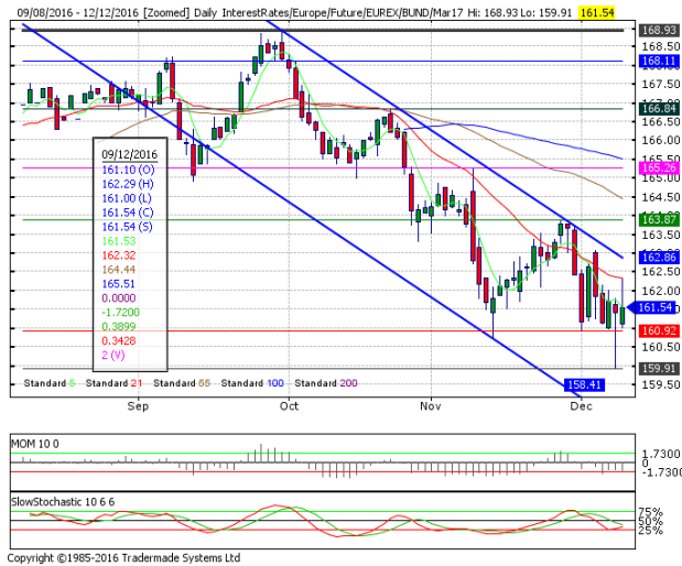
德國 10 年期國債：(H17) 受阻通道上軌前方

阻力位 4：163.06 12月5日高點 阻力位 3：162.86 日下跌通道上軌 阻力位 2：162.32 12月5日小時阻力位、21日均線 阻力位 1：161.66 12月9日小時阻力位