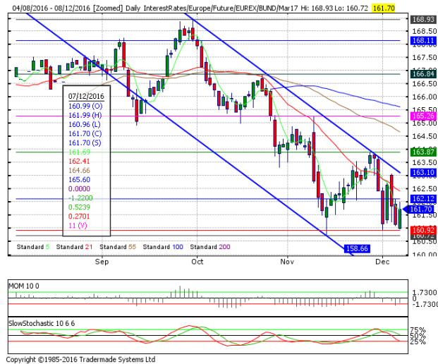
德國 10 年期國債：(H17) 空頭目標通道下軌

阻力位 4：163.10 日下跌通道上軌 阻力位 3：163.06 12月5日高點 阻力位 2：162.32 12月5日小時阻力位 阻力位 1：162.12 12月6日高點