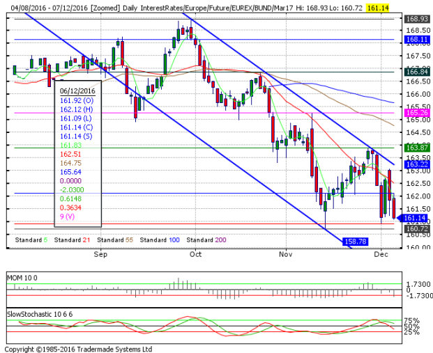
德國 10 年期國債：(H17) 空頭目標通道下軌

阻力位 4: 163.06 阻力位 3: 162.32 阻力位 2: 162.12 阻力位 1: 161.40 前收盤價: 161.14 支撐位 1: 160.92 支撐位 2: 160.72 支撐位 3: 159.14 支撐位 4: 158.78 12月5日高點 12月5日小時阻力位 12月6日高點 12月6日小時阻力位 12月1日低點 11月14日所創月低點 11月14日所創月低點(連續) 日下跌通道下軌