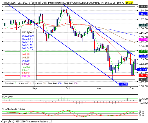
德國 10 年期國債：(Z16) 受阻下跌通道上軌前方