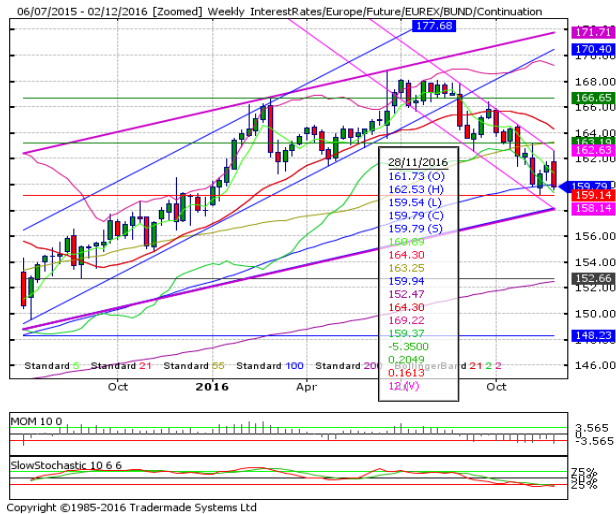
德國 10 年期國債：(Z16) 壓力重返 11 月份低點

阻力位 4：161.12 11 月 30 日小時支撐，現為阻力位 阻力位 3：161.07 21 日均線 阻力位 2：160.73 12 月 1 日小時阻力位 阻力位 1：160.17 12 月 1 日小時支撐，現為阻力位