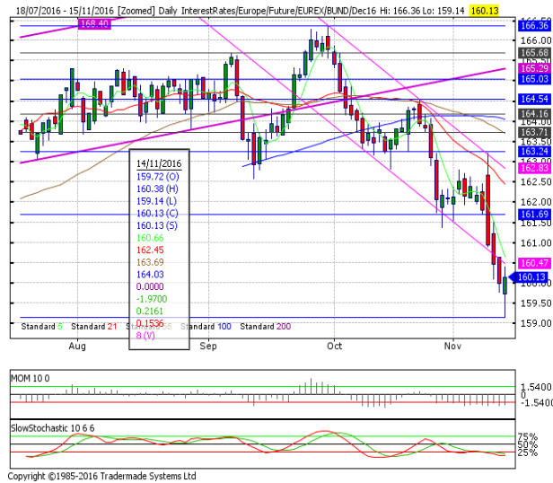
德國 10 年期國債：(Z16) 試探 100 周均線

阻力位 4：161.71 11 月 9 日小時阻力位 a 阻力位 3：161.08 可變小時支撐/阻力位 阻力位 2：160.81 11 月 10 日小時阻力位 阻力位 1：160.38 11 月 14 日高點