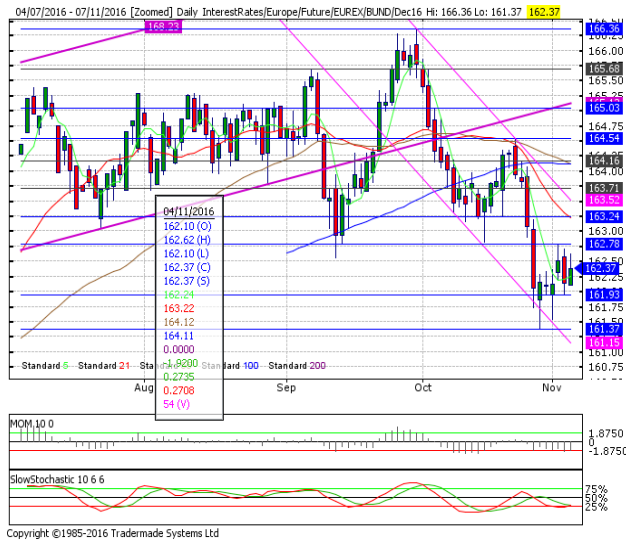
德國 10 年期國債：(Z16) 161.31-94 支撐區域至關重要