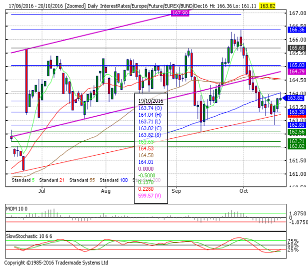
德國 10 年期國債：(Z16) 徘徊於 100 日均線附近

阻力位 4：165.03 10月5日高點 阻力位 3：164.53 21日均線 阻力位 2：164.50 55日均線 阻力位 1：164.01 100日均線