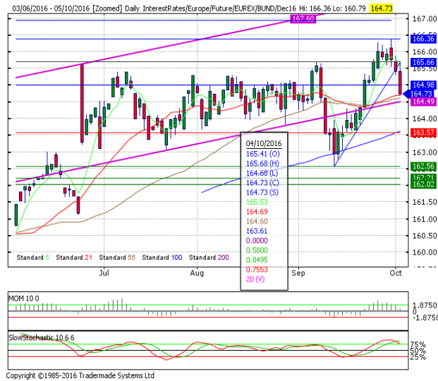
德國 10 年期國債：(Z16) 壓力轉向 55 日均線

阻力位 4：166.36 9月30日高點 阻力位 3：165.85 10月3日高點 阻力位 2：165.68 10月4日高點 阻力位 1：165.00 10月4日小時阻力位